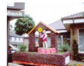
Der kollegiale Zusammenhalt wird großgeschrieben. 1985 steht auf dem Wagen der Volksbank: „Bei uns scheint immer die Sonne“.