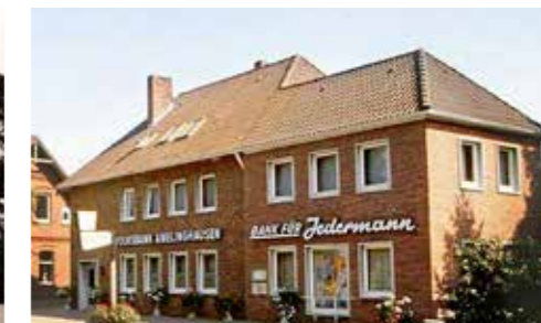
1968 erweitert die Spadaka ihr Haus durch einen Anbau (rechts).