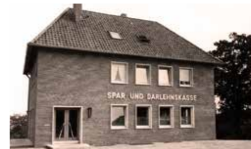
Das Gebäude bietet Platz für großzügige Geschäftsräume und eine Wohnung für den Rendanten im Obergeschoss.

Die Spadaka bezieht ihr erstes eigenes Gebäude am heutigen Standort in der Lüneburger Straße 45. Schon zwei Jahre zuvor war der Ankauf des Grundstücks beschlossen worden. Das neue Geschäftshaus wird nach einem Entwurf der Bauberatungsstelle des Verbandes Ländlicher Genossenschaften in Hannover errichtet und kostet 108.000 DM. Die Bilanzsumme der Bank übersteigt zum ersten Mal die Millionengrenze.