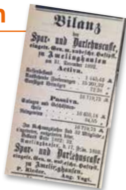
Die erste Bilanz der Spadaka Amelinghausen, veröffentlicht am 18. Februar 1893 in den Lüneburgschen Anzeigen