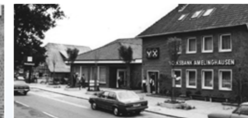
Bild links: Betzendorf wird eine Filiale der Volksbank Amelinghausen eG. Bild rechts: Der gesamte Kundenverkehr wird ab sofort im Neubau (links) abgewickelt.