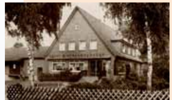
Nach dem Umbau im Jahr 1963 sind das Sitzungszimmer und die Rendantenwohnung durch einen Eingang an der rechten Seite zu erreichen.