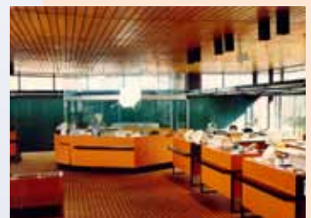
Nach Ideen von Architekt Siegfried Korth entsteht 1974 eine 280 qm große Schalterhalle. An zwölf Abfertigungsschaltern können Kunden betreut und bedient werden.