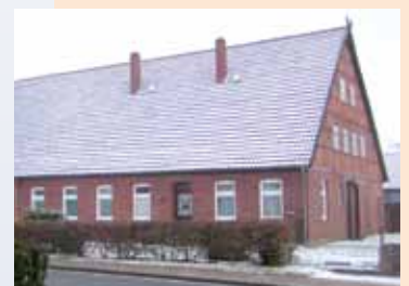
Die Spadaka Maschen teilt sich 1952 den Eingang mit dem Gemeindebüro.