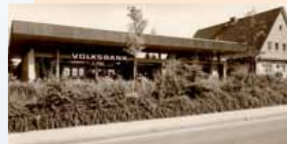
Die Volksbank Seevetal eG eröffnet im Februar 1974 ihren modernen Erweiterungsbau.