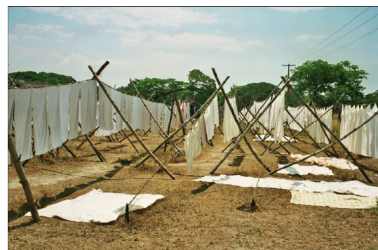
Der gemeinschaftlich genutzte Trockenplatz

Aus einem Feature des MDR von Matthias Körner