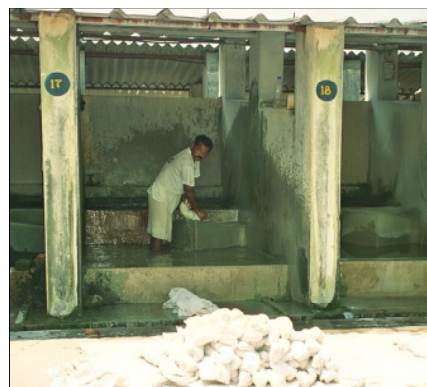
Wäsche waschen ist Männersache!

gleichermaßen anerkannt zu sein. Er forderte mit seiner liberalen Grundeinstellung keine geringeren als Lassalle, Marx, Engels und Bismarck heraus. Kern seiner Lehre ist die Hilfe durch Selbsthilfe und die Verantwortlichkeit für das eigene Tun. Es geht ihm um die Solidarität zum Machen und nicht um die zum Nehmen oder Geben. Er entwickelte mit dem Genossenschaftsgedanken ein Werkzeug zur Überwindung von sozialer Not, unterwies die Betroffenen in seinem Gebrauch und erstritt eine bis heute gültige juristische Basis dafür. Sein im Grunde simpler Gedanke war: Durch Addition von Armut kann sich Armut selbst Reichtum schaffen. Nach dem Grundsatz der Selbsthilfe schließen sich kleine, einzeln kaum lebensfähige Betriebe zu einem größeren Ganzen zusammen und können so bei Einkauf, Absatz, Kreditbeschaffung und