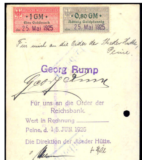
Wechsel mit Goldmark-Steuermarken

Ein Wechsel ist praktisch Geldersatzmittel. Da der Staat das Alleinrecht zur Ausgabe von Geld hatte, ersann er schnell die Wechselsteuer. Der Norddeutsche Bund beschloss erstmalig ein Wechselsteuergesetz am 10.6.1869. Die Steuer betrug 10 Pfennig für jede angefangene 100 Mark Wechselsumme und wurde durch Steuermarken entrichtet, die es bei der Post zu kaufen gab. Die Steuermarken mussten auf der Wechselrückseite oben quer aufgeklebt und entwertet werden. Darunter kamen die Indossamente. Am 21.6.1948 wurde der Satz um 50 Prozent auf 15 Pfennig erhöht.