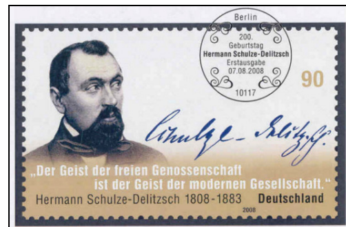
Sonderbriefmarke, Ausgabe 7. August 2008

Arbeitsorganisation mit den großen Unternehmen konkurrieren. So organisierte Schulze zuerst den Zusammenschluss der Delitzscher Schumacher: Jeder betrieb seine Schuhmacherei weiter in eigener Verantwortung, zusammen bildeten sie aber eine Einkaufs-Association.